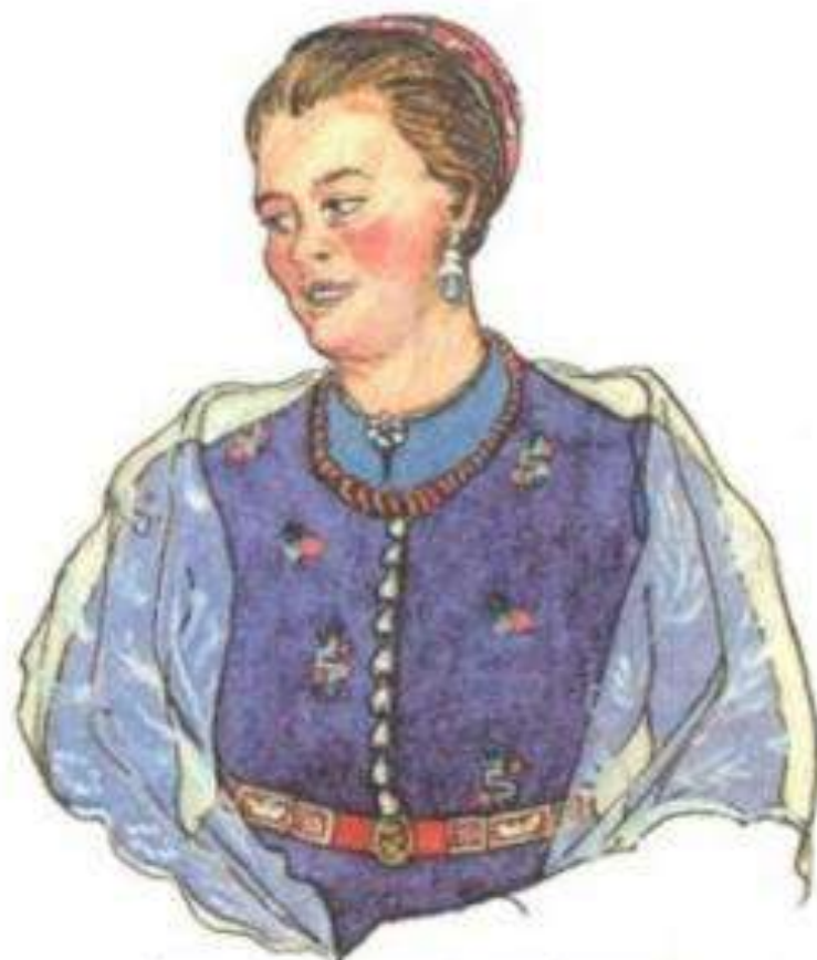
Замужняя казачка в праздничной одежде. Волосы стянуты в узел и прикрыты «кошаком»