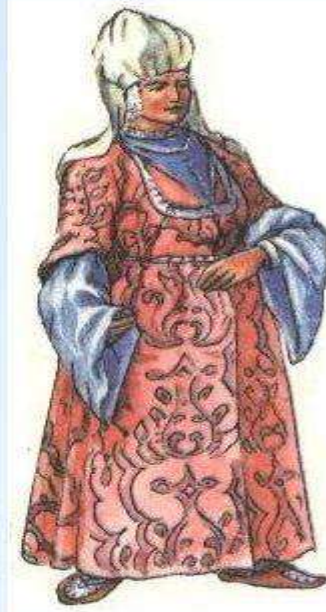
Жена старшины в празднично м наряде. XVII- XVIII века.