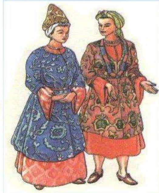
Казачка-вдова и девушка. XVII- XVIII века.

Женский костюм – это целый мир. Не только каждое войско, каждая станица и даже каждый казачий род имел особый наряд, который отличался от иных, если не совершенно, то деталями.