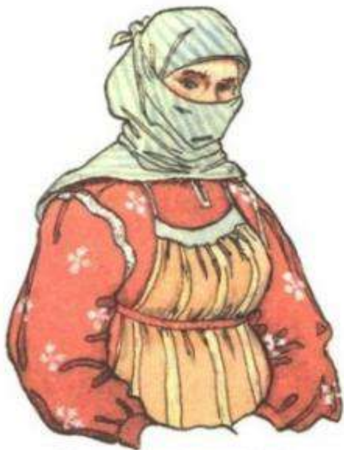
Казачка в повседневной одежде с «лавеской» — фартуком и «зanzhivкой» — платком, прикрывающим часть лица. XIX—XX века