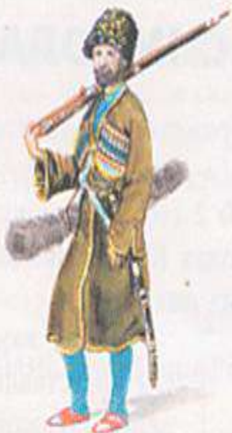
Одежда адыга. Конец XVIII в.