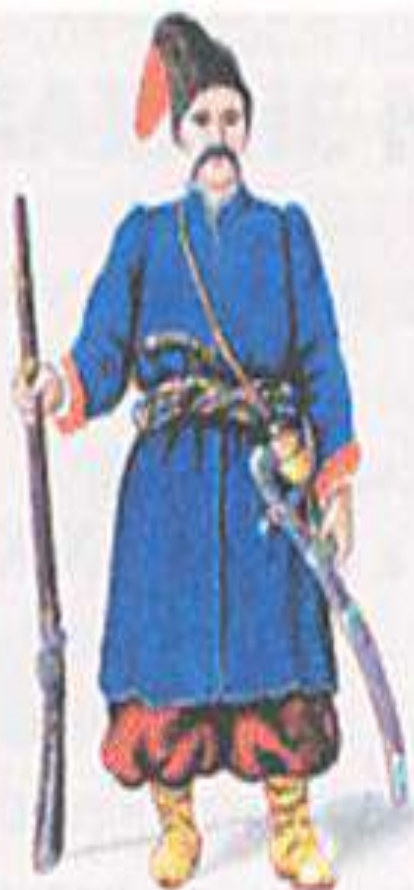
Одежда казака-черноморца. Конец XVIII в.