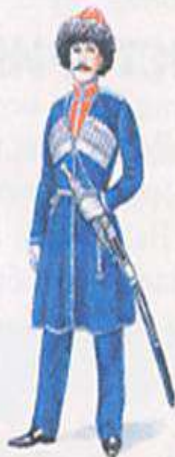
Форменная казачья одежда. Середина XIX в.