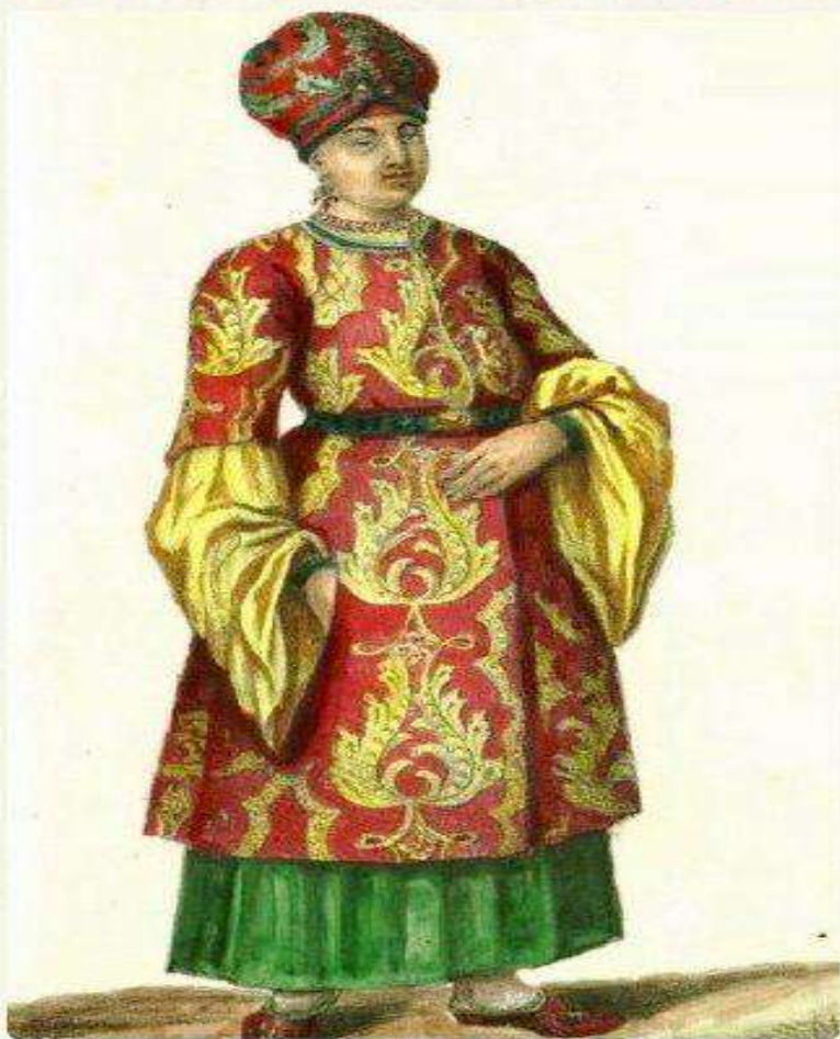
Казачка в кубелеке. «По женскому обряду».

Изображение 1.41 Иллюстрация к книге А.Ригельмана «История или повествования о донских козаках...» 1846.