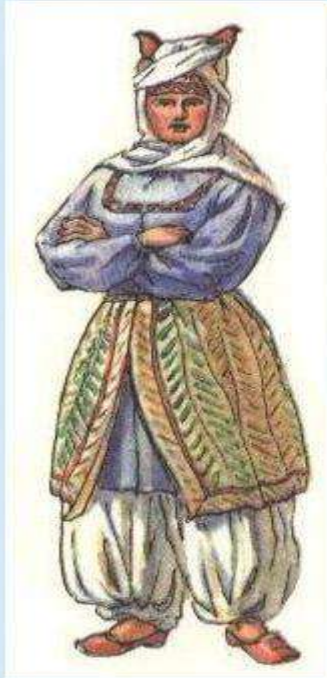
Верхнедонская казачка в XVII веке.