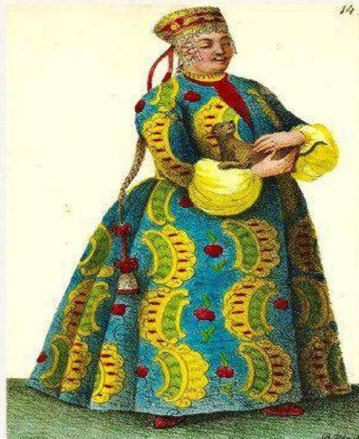
Донской девичий обряд богатых людей.

Изображение 1.40 Иллюстрация к книге А.Ригельмана «История или повествования о донских козаках...» 1846.