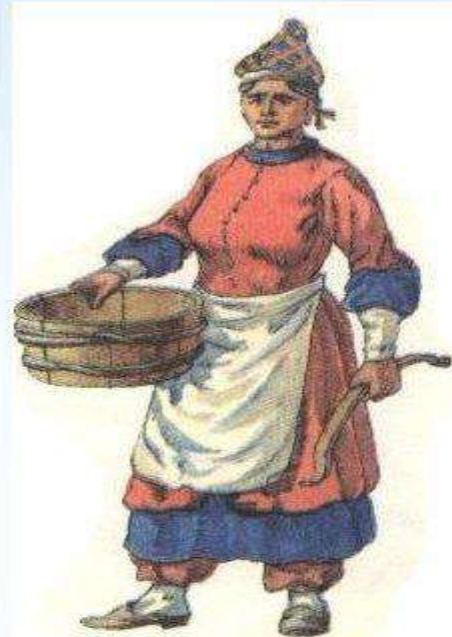
Нижнедонская казачка в повседневном костюме. XVII век.