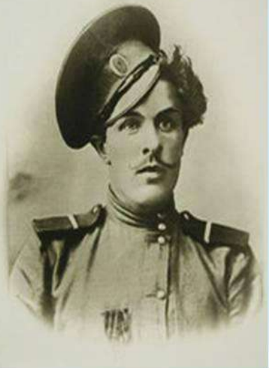
Первый георгиевский кавалер, донской казак Кузьма Крючков, убивший одиннадцать немцев и получивший 16 рань.

Первый георгиевский кавалер, донской казак Кузьма Крючков, убивший одиннадцать немцев и получивший 16 ран, во время Первой Мировой войны (1914-1918гг.)