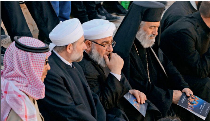
Представители различных конфессий объединились против ИГИЛ. На концерте симфонического оркестра петербургского Мариинского театра в Римском амфитеатре сирийской Пальмиры, освобожденной от террористов ИГИЛ.

В последнее время появилось значительное число верующих, причисляющих себя к крайним религиозным течениям (в СМИ упоминаются как «салафиты», «хариджиты», «ваххабиты»). Однако костяк ИГИЛ составляют лишь люди, причисляющие себя к ультрарадикальному крылу вышеназванных течений.