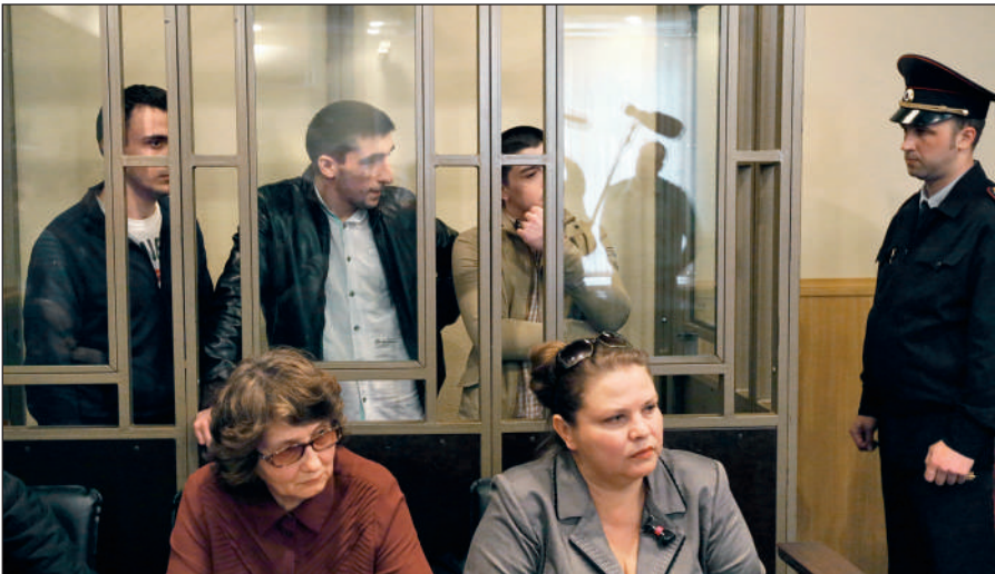
В Российской Федерации предусмотрена административная и уголовная ответственность за пропаганду идей терроризма, участие в деятельности террористических организаций.