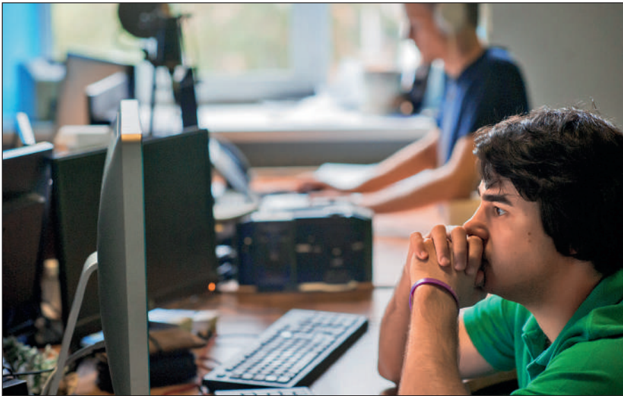
Постоянное присутствие вербовщиков ИГИЛ в соцсетях.

Активисты ИГИЛ поддерживают свои аккаунты в сетях Facebook, Twitter, Instagram, Friendica, Telegram. Активно они заявили о себе и в российских социальных сетях: «ВКонтакте» и «Одноклассниках».