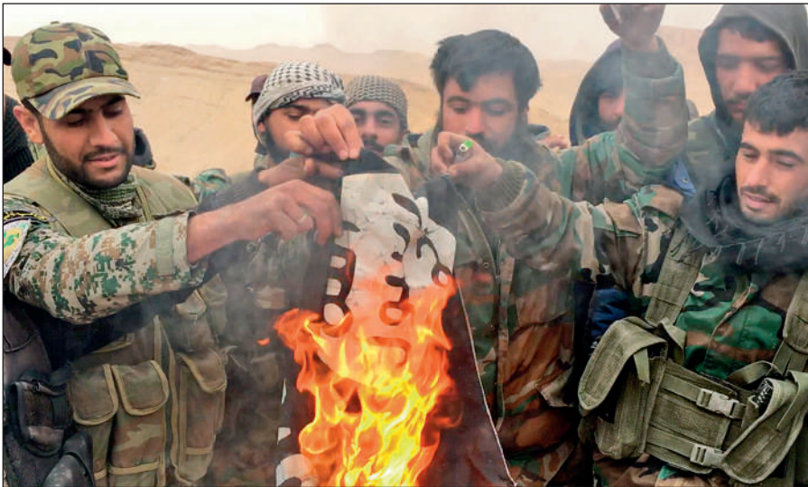
Народные ополченцы САР сжигают флаг ИГИЛ, снятый с отбитой у боевиков цитадели Пальмира.

Современное государство обязано защищать интересы каждого своего гражданина вне зависимости от его расы, национальности, принадлежности к определенной конфессии или религиозной традиции, в то время как ИГИЛ выражает интересы небольшой группы религиозных радикалов, жестоко подавляя остальную часть населения посредством запугивания, насилия и террора.