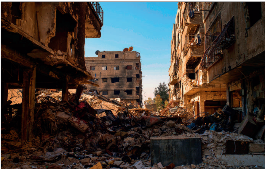
Разрушенный боевиками ИГИЛ Дамаск.

Террористы поставили на поток производство видеороликов с жестокими сценами казней пленников, заложников и «вероотступников». Эти материалы потом широко распространяются в социальных сетях и